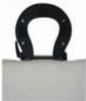
Support de tête

Attachez le vinyle au velcro au sommet du support de tête puis posez le coussin sur le support.