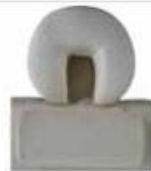
Coussin de tête